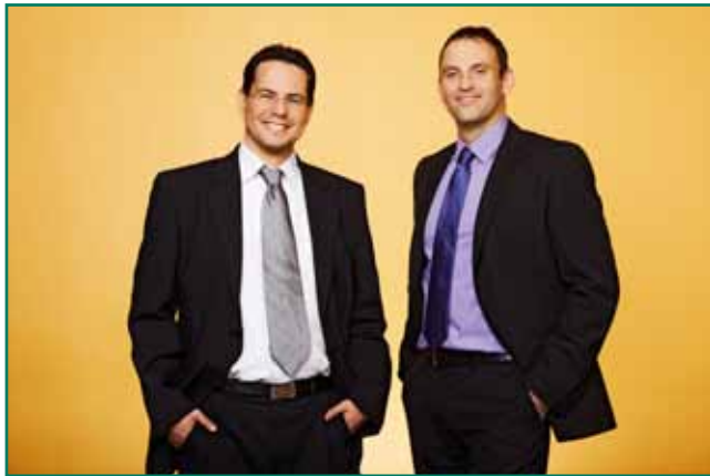
Die Geschäftsführer der Rackow-Schulen unterstützen den Verein.

der Verein der „Freunde und Förderer der Rackow-Schulen Frankfurt e.V.“ hat sich zum Ziel gesetzt, die Rackow-Schulen zu unterstützen und zu fördern.