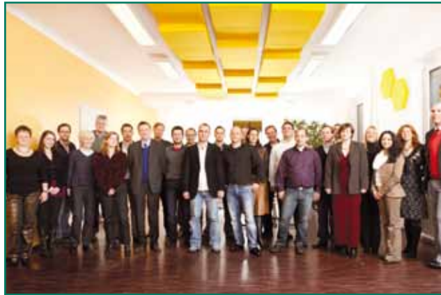
Die Lehrer der Rackow-Schule Frankfurt am Main.